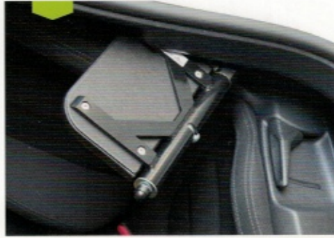
Planche de transfert, installée le long du siège, facilitant l'installation au poste de conduite. Pratique et robuste, dotée d'un système de verrouillage/déverrouillage rapide.